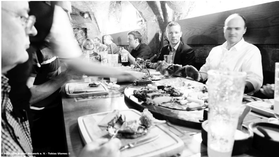
Nachwächterschmaus im Restaurant Comturei