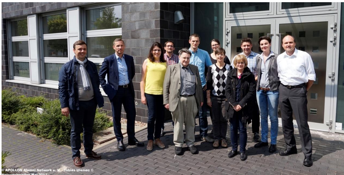
Teilnehmer des Netzwerktreffens / BarCamp 2017